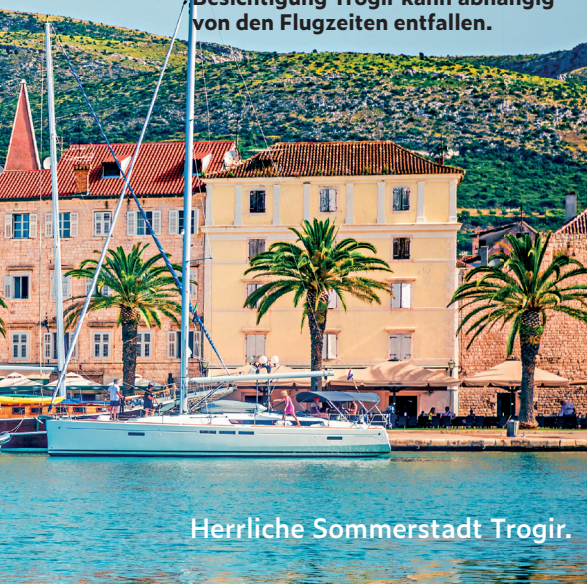
Herrliche Sommerstadt Trogir.

Besichtigung Trogir kann abhängig von den Flugzeiten entfallen.